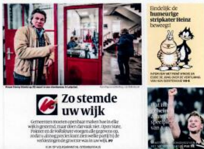
Voorpagina van de Volkskrant over de verkiezingsdata