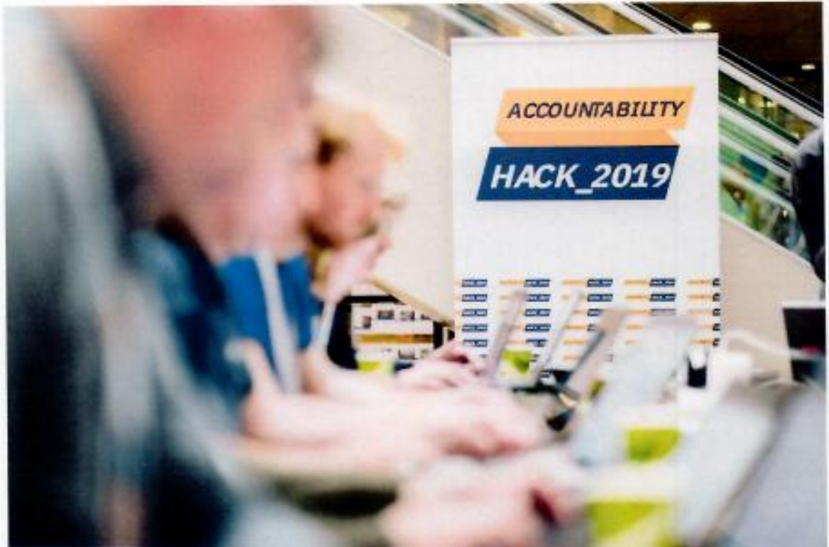
Accountability Hack 2019.