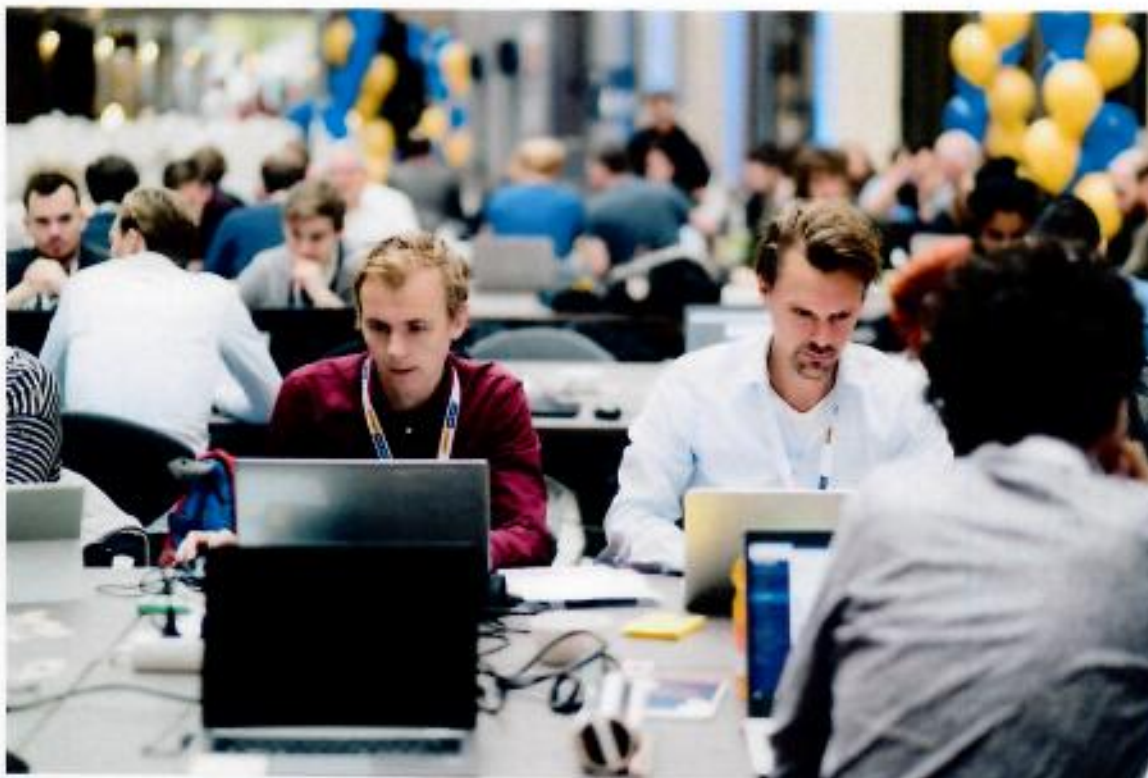
Accountability Hack 2019.

verder kunnen gaan helpen. Ook hopen we dat anderen geïnspireerd zijn om ook met open data van de overheid aan de slag te gaan.