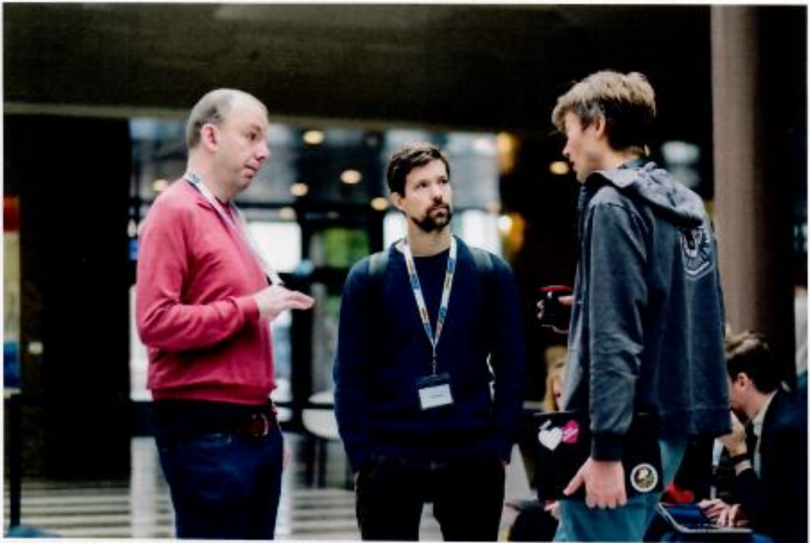
De developers van OSF.